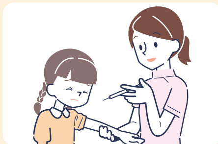
② 注射などの清潔/無菌操作の前