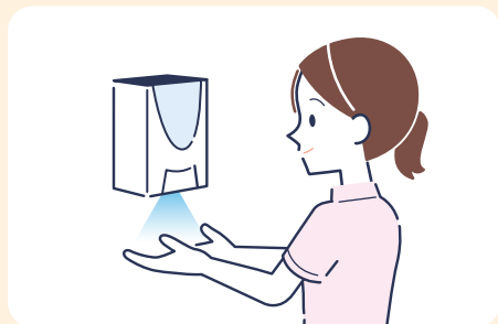
① 患者さんに触れる前