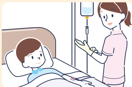
④ 体液に触れた可能性がある時