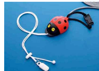
離床センサーの例