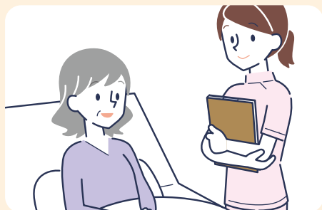
⑤ 患者さんに触れた後