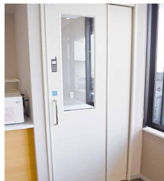
携帯電話通話ボックス

※院内では携帯電話をマナーモードに設定してください。 ※携帯電話を操作する際は、キー操作音を消音モードに設定してください。